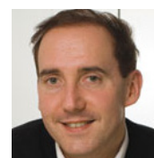
Gaël Giraud SJ Economiste, chercheur CNRS Jésuite