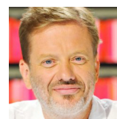
Alexis Jenni Prix Goncourt 2011 Professeur au lycée St-Marc