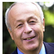
Alain Mérieux PDG du Groupe Mérieux